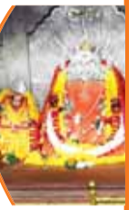
मां के दर्शन कर मांगते हैं मन्नतें

भोपाल से 70 किलोमीटर दूर प्रसिद्ध शक्तिपीठ बिजासन धाम सलकनपुर में चैत्र नवरात्रि में करीब 5 लाख श्रद्धालु माता बिजासन के धाम पहुंचेंगे। माता बिजासन के दर्शन कर अपनी मन्नतें मांगेंगे। लाखों की संख्या में श्रद्धालु माता बिजासन के दर्शन करने हर वर्ष आते हैं। बिजासन धाम सलकनपुर में माता बिजासन के दर्शन करने के लिए यहां पर सड़क मार्ग, रोववे सहित सीढ़ियों से भी माता के दर्शन करने लोग पहुंचते हैं। वैसे तो यहां पर साल भर श्रद्धालुओं का आना-जाना लगा रहता है।