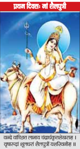
वन्दे वाकिष्ठ लामाय चंद्रार्धतशेखरम् । वृषारूढां शूक्रधरां शैलपुत्रीं यशस्विनीम् ॥