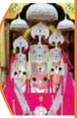
तंत्रिक साधना का यह आदर्श स्थान

चैत्र नवरात्रि को लेकर मां बगलामुखी मंदिर में तैयारियां पूर्ण हैं। इस बार मंदिर में लाखों श्रद्धालुओं के पहुंचने का अनुमान जताया जा रहा है, जिसे देखते हुए मंदिर प्रशासन ने व्यापक इंतजाम किए हैं। मंदिर परिसर को आकर्षक साज-सज्जा से सजाया जा रहा है और विशेष विद्युत व्यवस्था भी की गई है, ताकि श्रद्धालुओं को किसी प्रकार की असुविधा न हो। दर्शन व्यवस्था को सुगम बनाने के लिए जगह-जगह बेरिकेडिंग की गई है।