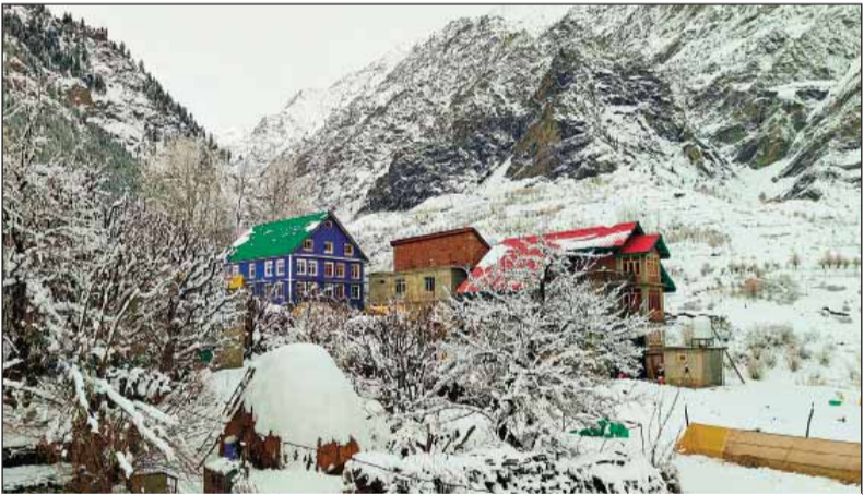
लाहौल और स्पीति। हिमाचल प्रदेश के लाहौल और स्पीति जिले के रशिल गांव में मंगलवार को ताजा बर्फबारी से ढंके घर ।