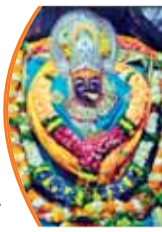
650 पुलिस कर्मियों की तैनाती की गई