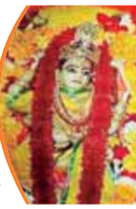
मंदिर के चारों द्वार खोल दिए जाएंगे

विश्व प्रसिद्ध तंत्रिक शक्तिपीठ मां पीतांबरा मंदिर में चैत्र नवरात्र पर्व की तैयारियां पूरी कर ली गई हैं। गुरुवार से आरंभ हो रहे इस पावन पर्व पर दतिया का माहौल देवी भक्ति और आस्था से सराबोर होगा। मंदिर के चारों मुख द्वार आकर्षक सजावट के साथ भक्तों के लिए खोल दिए जाएंगे। देशभर से साधक और श्रद्धालु मां पीतांबरा के दर्शन के लिए दतिया पहुंच रहे हैं। मंदिर से मंत्र दीक्षा प्राप्त साधकों को किसी प्रकार की परेशानी न हो, इसके लिए मंदिर प्रबंधन ने विशेष इंतजाम किए हैं।