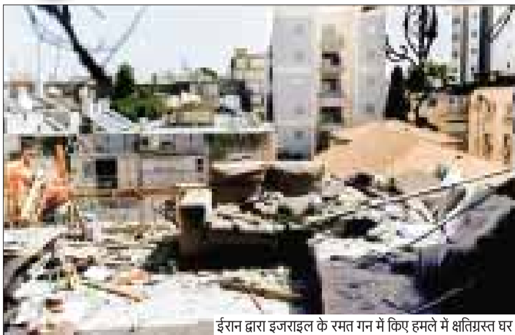
ईरान द्वारा इजराइल के रमत गन में किए हमले में क्षतिग्रस्त घर

2 लेबनान में हिज्बुल्लाह के खिलाफ लड़ाई और तेज करेगा इजराइल