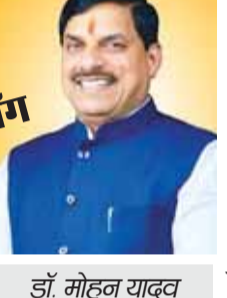
डॉ. मोहन यादव

चैत्र शुक्ल प्रतिपदा से प्रारंभ होने वाला नवसंवत्सर हमारी सांस्कृतिक चेतना, वैज्ञानिक दृष्टि और प्राकृतिक जीवन पद्धति का प्रतीक है। इस वर्ष विक्रम संवत् 2083 का शुभारंभ हुआ है। यह मध्यप्रदेश के लिए गर्व और गौरव का विषय है कि भारतीय कालगणना की गौरवशाली परंपरा उज्जयिनी से प्रारंभ हुई है। सम्राट विक्रमादित्य के राज्याभिषेक से आरंभ हुआ विक्रम संवत् भारतीय संस्कृति की चेतना और राष्ट्र की अस्मिता का प्रतीक है। भारतीय नववर्ष प्रकृति के नवोदय का पर्व है। इस समय प्रकृति नवजीवन से समृद्ध होती है, पृथ्वी पर नवचेतना और नवसृजन का संचार होता है। देश भर में मनाए जाने वाले नवसंवत्सर के विभिन्न नाम हैं। इसी दिन से चैत्र नवरात्र का भी शुभारंभ होता है। नवरात्र के नौ दिन साधना, आत्मशुद्धि और शक्ति उपासना का अवसर है। भारतीय जीवन पद्धति में पर्व और परंपराएं व्यक्ति और समाज के समग्र विकास का मार्ग प्रशस्त करती हैं। मध्यप्रदेश में नवसंवत्सर का आयोजन विकास और जनकल्याण के नए संकल्पों के साथ किया जा रहा है। नवसृजन के प्राकृतिक उत्सव अवसर पर मुझे यह बताते हुए प्रसन्नता है कि मध्यप्रदेश में यह वर्ष कृषक कल्याण वर्ष के रूप में मनाया जा रहा है। इस वर्ष हमने पहली कृषि कैबिनेट बैठक बड़वानी जिले के भोलट बाबा देवस्थल नागलवाड़ी में की है। इसमें कृषि विकास और कल्याण के लिए 27 हजार 500 करोड़ रुपए की योजनाओं को स्वीकृत किया गया। भारतीय नववर्ष का आयोजन हमें प्रकृति संरक्षण की प्रेरणा देता है। हमारी परंपरा में गुड़ी पड़वा के दिन सूर्योदय से